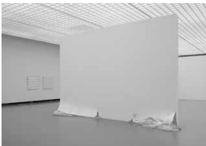
Oscar Tuazon, Dead Wrong, 2011/2012, courtesy: Oscar Tuazon

OT: Ik gebruik veel gereedschap dat 'site specific' is, ik gebruik architectonische technieken waar ik ze kan gebruiken, maar die dingen hebben geen enorme ideologische waarde voor mij. Mij maakt het niet uit of iets dat voor een bepaalde locatie is gemaakt ergens anders wordt geplaatst. Als het