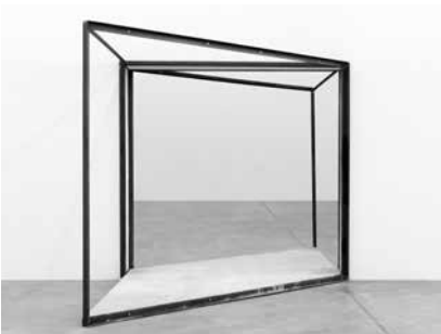
Oscar Tuazon, White Walls, 2011/2012, courtesy: Oscar Tuazon en / and Galerie Eva Presenhuber, Zurich

Tentoonstelling / Exhibition: Minimal Myth, Museum Boijmans Van Beuningen, 2012). Foto / Photo: Lotte Stekelenburg