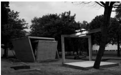
Oscar Tuazon, Raped Land en / and The Trees, 2011, courtesy: Oscar Tuazon en / and Galerie Eva Presenhuber, Zurich

Collectie / Collection: Aishti Foundation. Foto / Photo: Stefan Altenburger Photography, Zurich