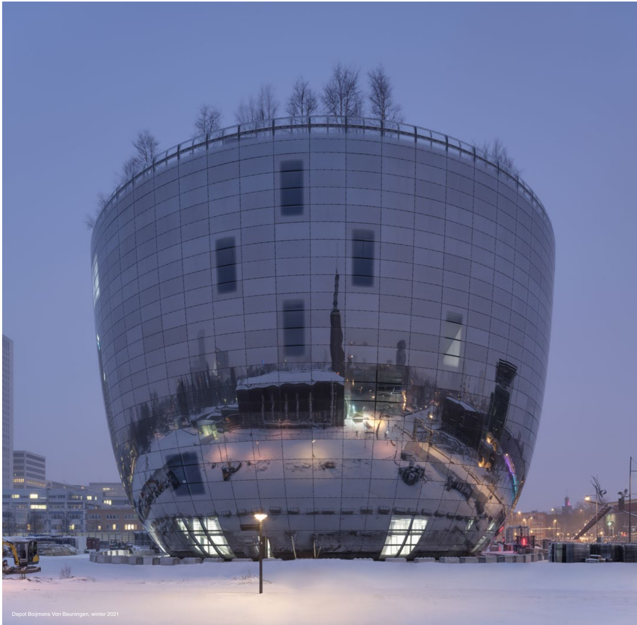
Depot Boijmans Van Beuningen, winter 2021