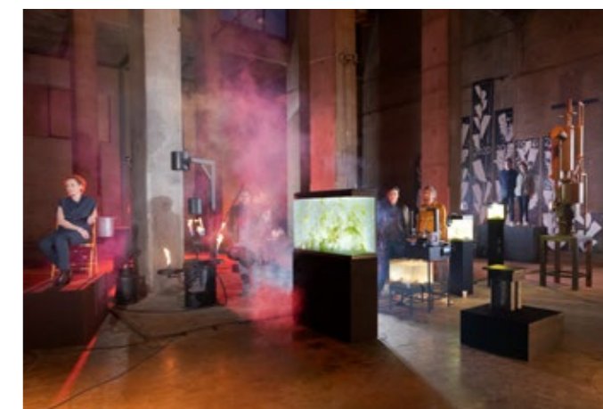
De afbreekeconomie online tentoonstelling, april tot en met december 2021, Museum Boijmans Van Beuningen, Rotterdam

In 2016-2017 heeft het museum in samenwerking met kunstenaar Peter Struycken en Philips Lighting een nieuwe lamp ontwikkeld van 5700 kelvin, die in combinatie met de TL-lampen die het museum gebruikt, zoveel mogelijk het daglicht benadert. Hierdoor komen de kleuren in de kunstwerken optimaal tot hun recht, alsof de bezoeker in een kunstenaarsatelier staat met noorderlicht. Bij de nieuwe collectieopstelling in 2017 is de Boijmans spot voor het eerst in gebruik genomen.