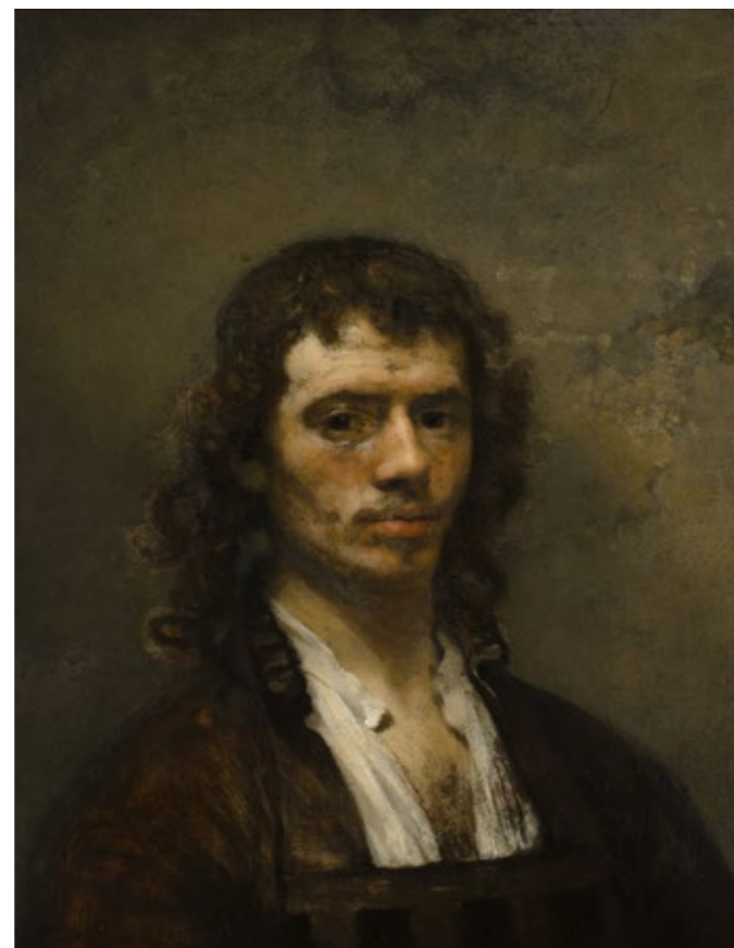
Carel Fabritius, Zelfportret , circa 1645, Collectie Museum Boijmans Van Beuningen, Rotterdam. Uit de nalatenschap van: F.J.O. Boijmans 1847.

In 2032 heeft Museum Boijmans Van Beuningen meerdere gedaanten. Het museum en depot zijn fysiek aanwezig in Museumpark, in een samenhangend netwerk van gebouwen en bouwdelen die samen zijn geschiedenis en de achtereenvolgende visies op de band tussen mensen en kunst reflecteren. De kunst kan er in al haar verscheidenheid worden beleefd. Het park fungeert als een museale buitenruimte die de bouwdelen verbindt met elkaar, met de naburige culturele instituten, de Westersingel en de binnenstad. Daarnaast bestaat het museum virtueel en wereldwijd als digitale constructie. 1 In beide verschijningsvormen is ruimte voor zowel de individuele als de collectieve beleving van kunst.