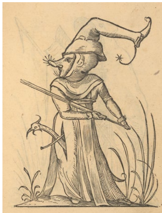
François Desprez, Vrouwenfiguur met grote laars op het hoofd , 1565. Collectie Museum Boijmans Van Beuningen, Rotterdam. Aankoop met steun van: Vereniging Rembrandt (mede dankzij haar Themafonds Middeleeuwen en Renaissance) en Stichting Lucas van Leyden 2020.

Museum Boijmans Van Beuningen heeft een voor Nederland uitzonderlijke collectie vroege schilder-, teken- en prentkunst met als enige museum in Nederland werk van Jan van Eyck, Dieric Bouts en Jheronimus Bosch. Ook wat betreft vroege buitenlandse kunst neemt het een unieke positie in met topstukken uit de Franse en Duitse vijftiende-eeuwse schilderkunst. De doorlopende wederzijdse beïnvloeding tussen Nederlandse, Duitse en Franse beeldhouwers, schilders, tekenaars en grafici is een belangrijk focusgebied en onderwerp voor tentoonstellingen (zoals De weg naar Van Eyck 2012-2013 ), aankopen en onderzoek. Vanuit het ALMA (Afbeelding Linkt Met Artefact) project worden er ook verbanden gelegd tussen schilderijen en prenten en voorwerpen uit dezelfde periode die daarop zijn afgebeeld, en dikwijls ook in de museumcollectie aanwezig zijn. Dit resulteert regelmatig in verleende bruiklenen, zoals voor het grote Bruegelretrospectief in Wenen in 2018.