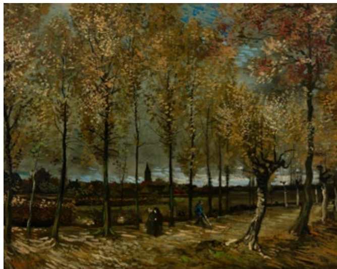
Vincent van Gogh, De populierenlaan bij Nuenen , 1885, Collectie Museum Boijmans Van Beuningen, Rotterdam. Schenking: 26 Rotterdamse kunstvrienden 1903.

zal aanvullend onderzoek worden uitgevoerd. Door gezamenlijk preventieve maatregelen te ontwikkelen worden de fotografiecollecties op een juiste manier geconserveerd en de kennis erover wordt vastgelegd binnen de organisaties. Ook worden er twee jonge professionals opgeleid, die zich specialiseren in dit vakgebied. Deelonderzoeken worden door masterstudenten Conservering en Restauratie uitgevoerd.