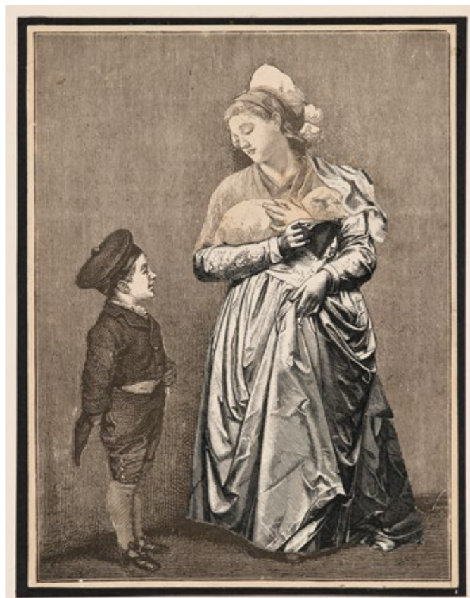
Joseph Cornell, Untitled , circa 1930-1940, Collectie Museum Boijmans Van Beuningen, Rotterdam. Aankoop met steun van: Stichting Lucas van Leyden 2019.