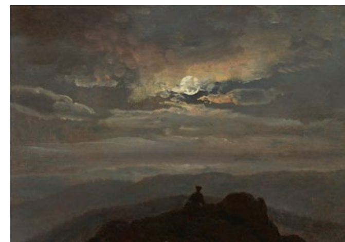
Johan Christian Dahl, Landschap bij maanlicht , 1823, Collectie Museum Boijmans Van Beuningen, Rotterdam. Aankoop met steun van: BankGiro Loterij 2017.

Het museum heeft in het verleden werken gekocht van individuen met een sterke worteling in een specifieke periode, van belang in de eigen tijd, en aldus ensembles gevormd van aankopen van steeds een kunstenaar, zoals Bas Jan Ader, Daan van Golden of Cindy Sherman. In navolging daarvan zouden aanvullende aanwinsten van het werk van bijvoorbeeld Paul Noble, Jim Shaw, en Carlos Amorales een versterking betekenen voor de collectie. Soms doet er zich een kans voor een imposant werk als Bunkhouse van een kunstenaar als Paul McCarthy te verwerven dat aansluit bij dit soort ensembles en dat alleen in een museum tot zijn recht komt.