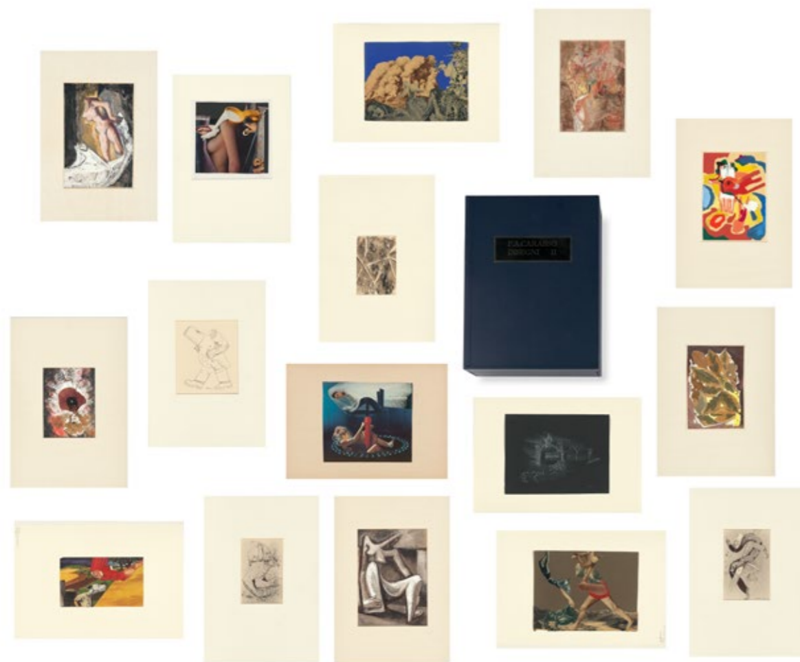
Selectie van werken uit de schenking van 514 tekeningen en collages van de Stichting Federico Antonio Carasso, uit de nalatenschap van de gelijknamige kunstenaar 2020.

Dikwijls is er in samenspraak met het museum verzameld en later geschonken, zoals de collectie Schoufour of Kalthorn Timmermans of de gebroeders Visser. Toch is het museum voorzichtig met het accepteren van nieuwe schenkingen en langdurige bruiklenen. Iedere schenking of bruikleen dient te voldoen aan de vastgestelde uitgangspunten voor opname in de collectie (zie hoofdstuk 5). Twee bijzondere schenkingen die het museum in 2020 in ontvangst mag nemen zijn 514 tekeningen en collages van de Stichting Federico Antonio Carasso, uit de nalatenschap van de gelijknamige kunstenaar en de omvangrijke surrealisme bibliotheek van het echtpaar Vancrevel en De Jong. Het museum vraagt en krijgt soms ook belangrijke werken in langdurig bruikleen, zoals het grote schilderij van Guercino David met het hoofd van Goliath (1657) van het Hoogheemraadschap Hollands Noorderkwartier. Bruiklenen kunnen echter worden teruggevraagd door de bruikleengever. Hoewel het gelukkig dikwijls mogelijk is gebleken om cruciale werken na beëindiging van de bruikleen in eigendom te verwerven heeft het museum even vaak gedwongen afscheid moeten nemen van belangrijke stukken zoals in 2017 van Interieur / Mlle Miroir, Mlle Collier et Mlle Sofa uit 1914 van Kees van Dongen dat vanwege de Franse belastingwetgeving werd teruggevraagd door de bruikleengever en om moverende redenen helaas niet werd gesteund door de gangbare steunfondsen.