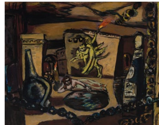
Max Beckmann, Apollo , 1942, Collectie Museum Boijmans Van Beuningen, Rotterdam. Gedeeltelijke aankoop met steun van: Vereniging Rembrandt (mede dankzij haar Themafonds Moderne kunst, haar Dura Kunstfonds en het Prins Bernhard Cultuurfonds) en Stichting Museum Boijmans Van Beuningen / Gedeeltelijke schenking: Marie Louise von Motesiczky Charitable Trust, 2020.

Het museum beschikt over een zeer gering eigen aankoopbudget van 50.000 euro per jaar, maar streeft ernaar om verschillende mogelijkheden van aanvullende financiering optimaal te benutten door het gebruik van fondsen op naam, huisstichtingen, geormerkt geld als de Bijdrage Collectieprogramma's van het Mondriaan Fonds en in samenhang te besteden bedragen als die van de BankGiroLoterij en Vereniging Rembrandt, de Erasmusstichting, Stichting Bevordering van Volkskracht en het Prins Bernhard Cultuurfonds op verschillende manieren in te zetten en daarmee te combineren. Het beschikbare geldbedrag uit de huisstichtingen is echter afhankelijk van de beurskoersen en de opbrengst van het stamkapitaal wordt altijd in stand gehouden. Voor alle grote aankopen is het museum volledig afhankelijk van het resultaat van fondsenwervingsacties, zoals in 2020 voor de aankoop van een belangrijk symbolistisch schilderij van Max Beckmann.